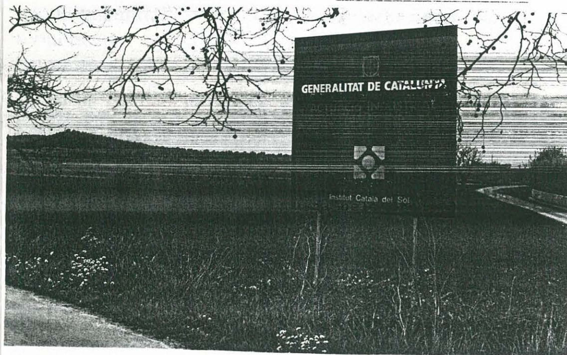
VISTA DE LA ZONA ON ANIRÀ EL FUTUR POLIGON INDUSTRIAL D'ULLDECONA.

L'Ajuntament en Ple va considerar molt interessant aquesta petició i li va donar llum verda. Sens dubte es tracta d'una bona inversió que repercutirà favorablement al Barri.